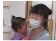
なごみ第二保育園入職

初めて保育園を見学した際、仕事中にも関わらず、職員が笑顔で挨拶してくれたことで緊張がほぐれ、自分も笑顔の素敵な保育者になりたいと感じました。また保育室がオープンになっていることでフロア中に楽しそうな声が響いていました。また子ども達がのびのびと遊んでいる姿を見て、就職を決めました。