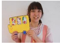
なごみ保育園入職