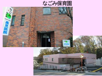
なごみ第二保育園

社会福祉法人七五三会は、町田駅から徒歩約5分、芹が谷公園にも近い、住宅地にあります。子どもから高齢者まで、地域で誰もが必要なサービスを受けられる町づくりに寄与することを目指しています。