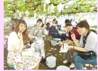
山梨ぶどう狩り・信玄もち詰め放題ツアー

七五三会では福利厚生の一環として職員交流を目的とした、バスツアー等を実施しています。職員同士の関係性が深まることで、働きやすい職場を作りたいと考えています。